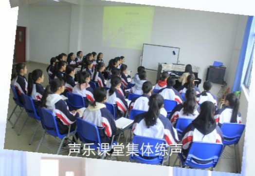
声乐课堂集体练声