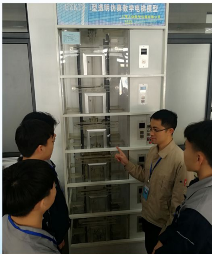
电梯程序编程与调试