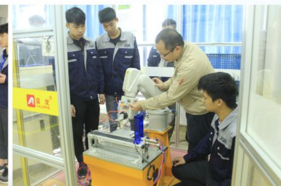
工业机器人一体化教学现场