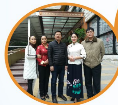
老师到南宁迪拜七星 酒店看望毕业生