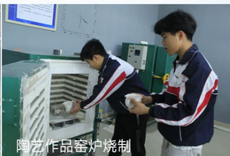
陶艺作品窑炉烧制