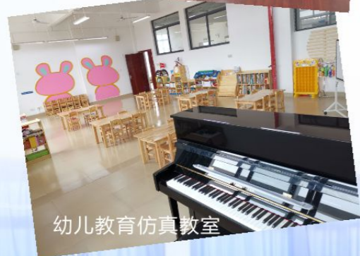
幼儿教育仿真教室