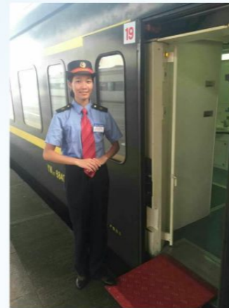
酒店专业学生在南宁铁路局 南宁客运段实习、就业