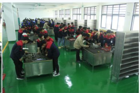
汽车底盘维修车间