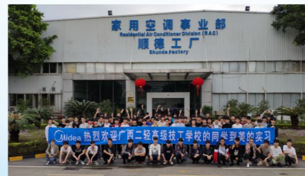
学生在美的集团实习、就业