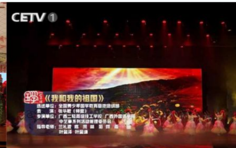
学生表演节目在 中国教育电视台 - CETV播出