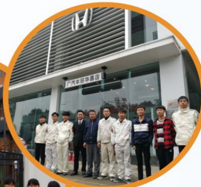
学生在广西华昌汽车 销售服务有限公司就业