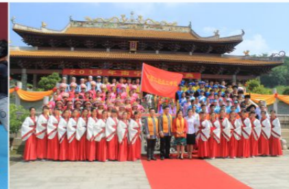
首届南宁市孔子文化节，我校策划成人礼活动