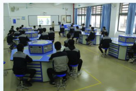
电气自动化专业一体化工作站