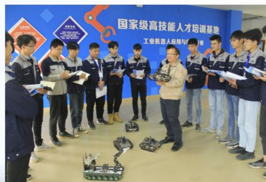
智能搜救小车实训