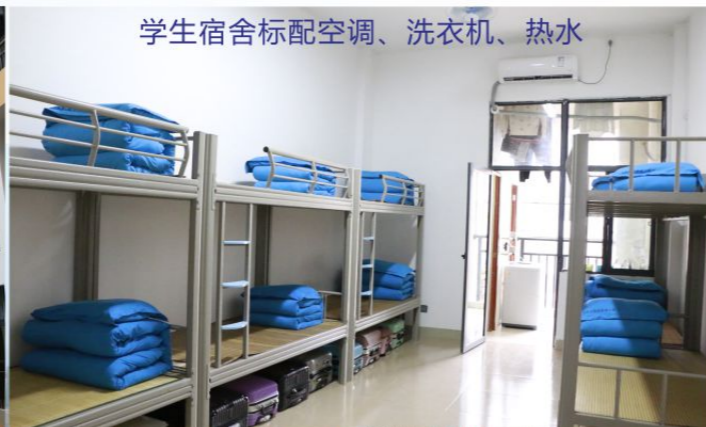
学生宿舍标配空调、洗衣机、热水