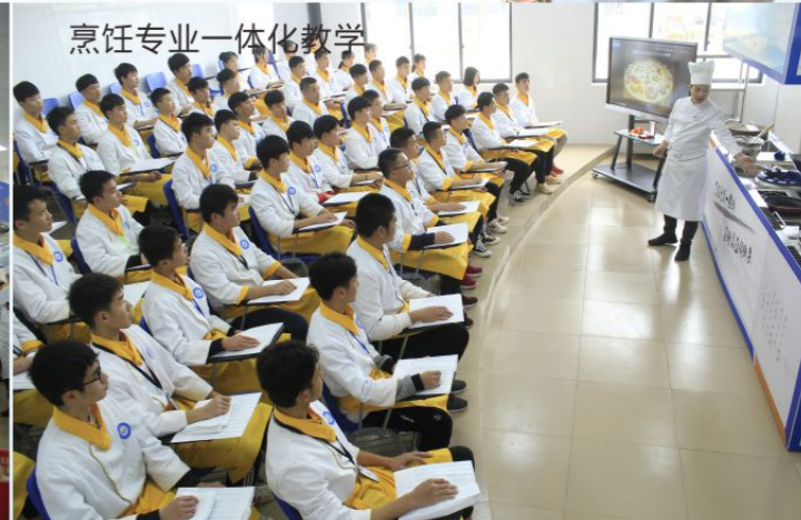
烹饪专业一体化教学