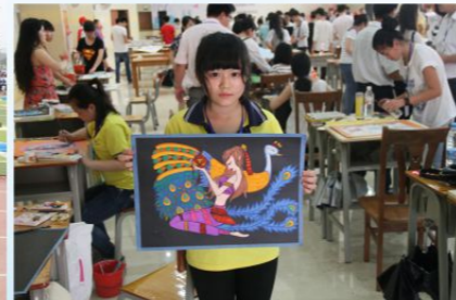
第五届区直院校校园文化艺术节比赛 《壮乡情》获绘画比赛一等奖