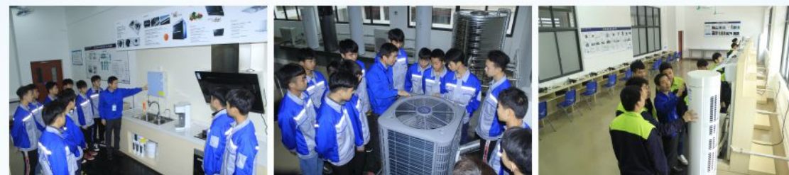
净水器安装与维护实训室 中央空调外机维修实训室 空调器内机维修实训室

OPERATION AND MAINTENANCE OF REFRIGERATION EQUIPMENT