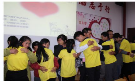
爱的实践-拥抱父母