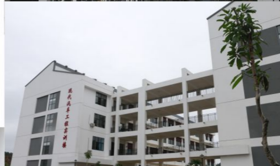
现代汽车工程实训楼