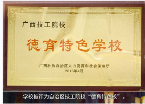
学校被评为自治区技工院校“德育特色校”。

学校大力推行德行教育，引导学生学会做人懂得感恩。2011年，学校专门成立德行教育办公室，依托现代化教育教学手段，运用中华优秀传统文化在全校开展感恩和励志教育，推进一日常规管理，创新我校德育工作的新模式。我校学生在中华优秀传统文化的熏陶下，逐渐成长为具有孝敬心、恭敬心、感恩心、仁爱心和责任心的“金色蓝领”。中华优秀传统文化教育作为我校德行教育的特色，在全区有着引领技工院校德行教育示范推广的作用和意义。自治区人社厅多次在我校召开了全区德育现场会，引起新闻媒体的高度关注和争相报道。