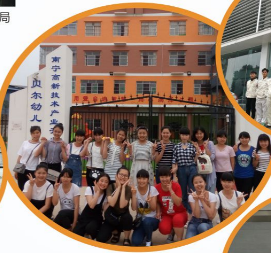
幼儿教育专业学生在 南宁市贝尔幼儿园实习、就业