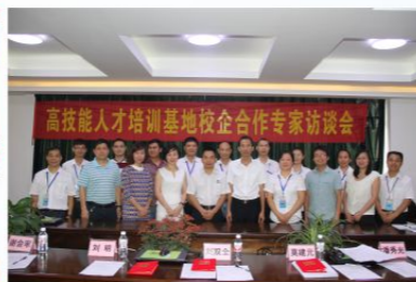
校企合作专家访谈会