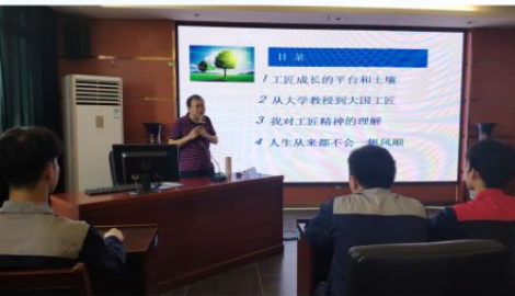
大国工匠李白千博士到我校开展讲座

学生社团是学校德行教育和内涵建设的主要阵地之一。学校高度重视学生社团的建设和发展，提供平台让学生快乐学习，陶冶情操，发展内涵，提高修养，让学生在快乐中学会做人，学会做事，让学生在校期间能够学到更多知识，为学生今后的就业奠定了良好的基础。学校开展了茶艺、调酒、咖啡、武术、电子竞技协会、篮球训练营、足球训练营、啦啦操、健美操俱乐部、视频制作、街舞、手工艺等70多个社团组织，这些社团活动极大地丰富了校园文化。