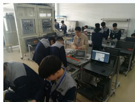
机电一体化设备安装与调试