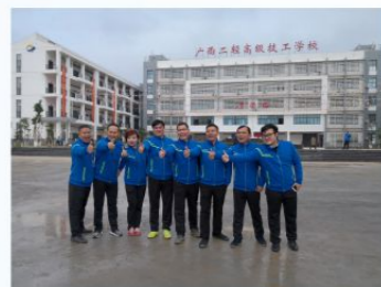
学校就业服务团队

我校毕业生均可按国家政策对口直升区内高职（大专）院校以及8所本科院校就读，对口本科招生院校有：广西科技大学、北部湾大学、广西科技师范学院、广西民族师范学院、百色学院、梧州学院、河池学院、贺州学院。