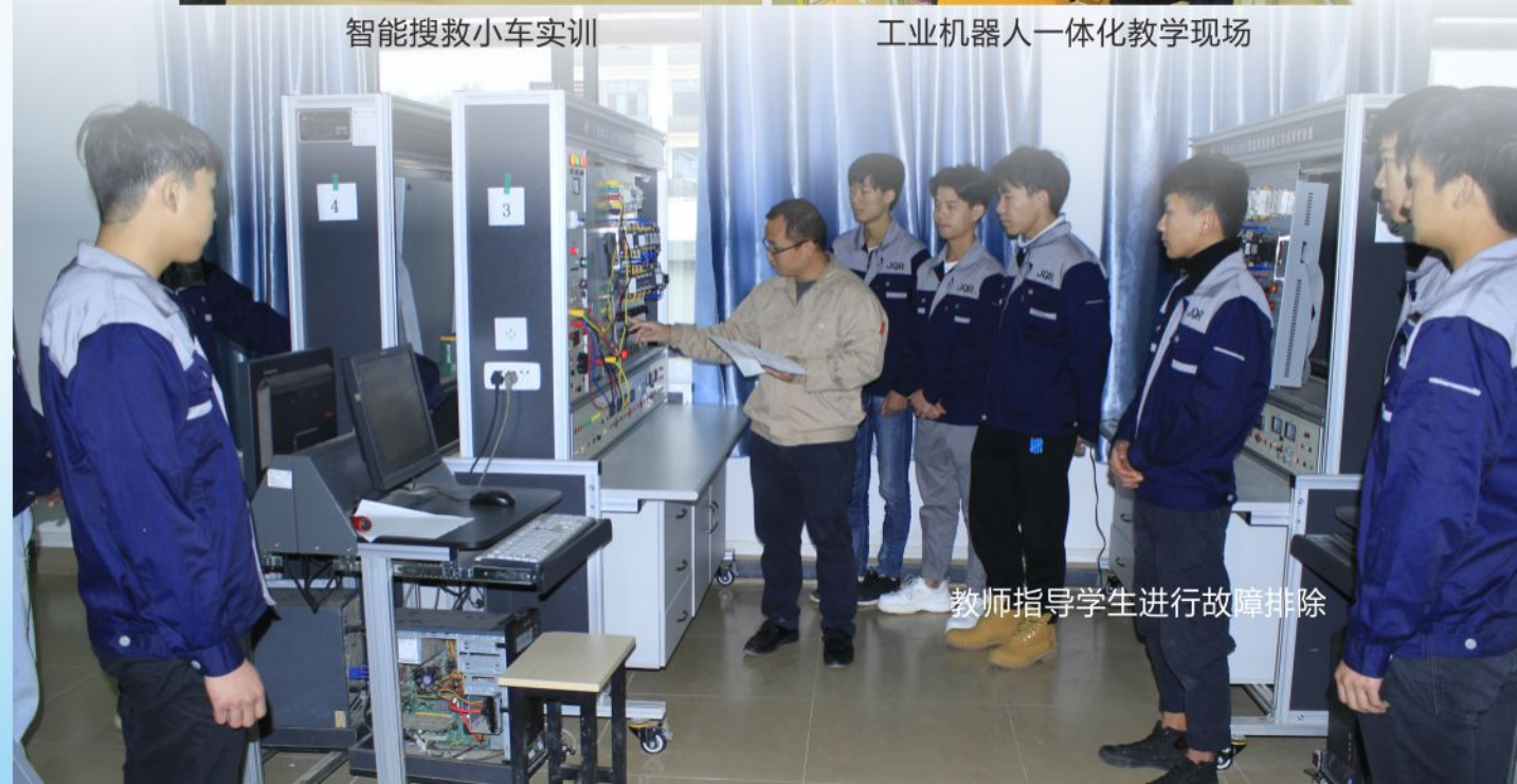
教师指导学生进行故障排除