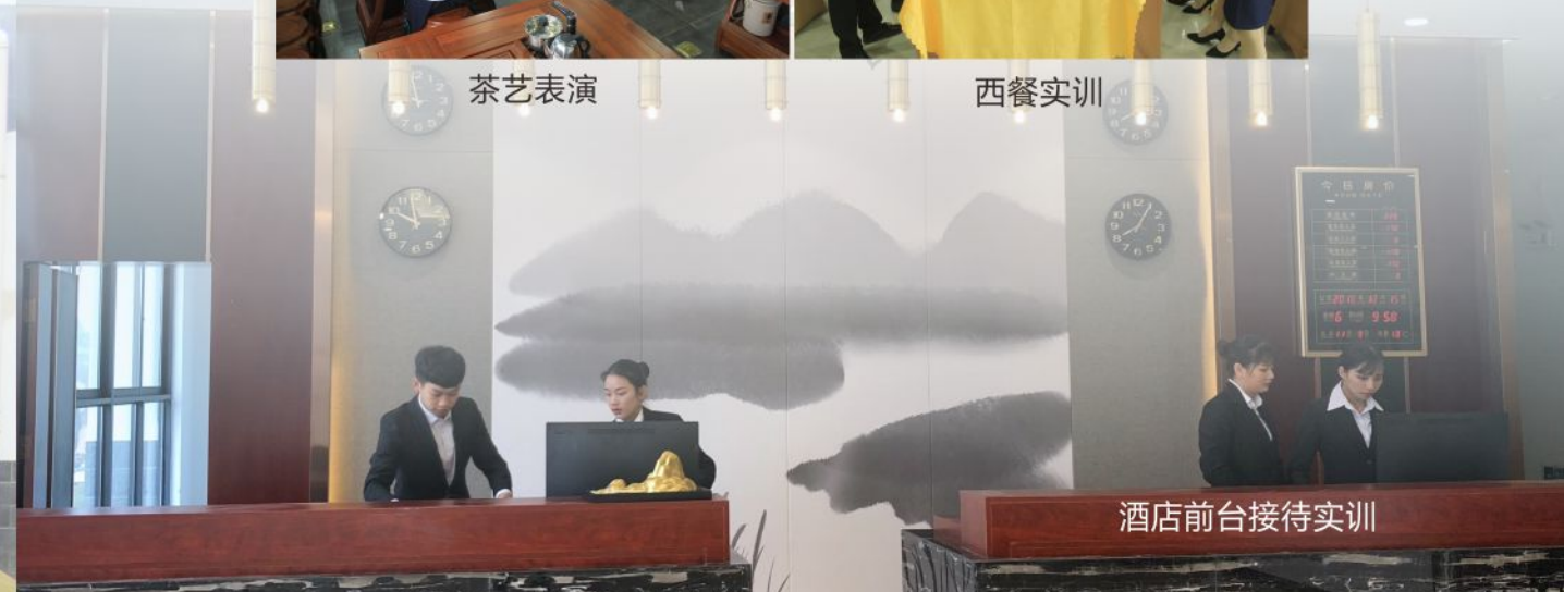
酒店前台接待实训