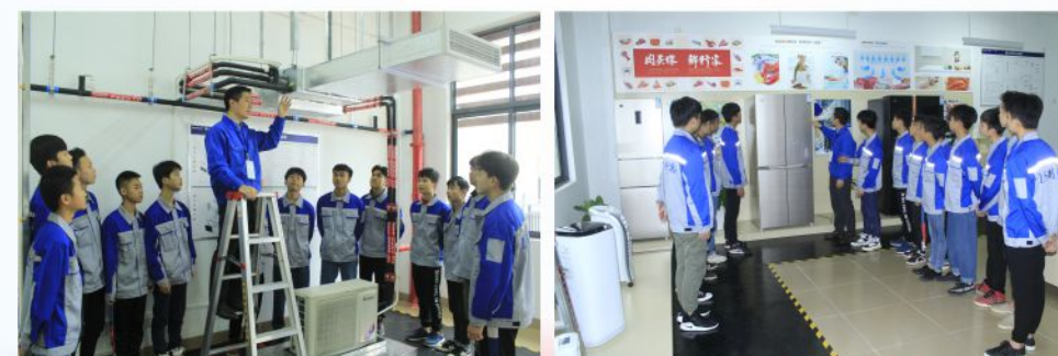
户式中央空调安装实训室 新型电冰箱维修实训室