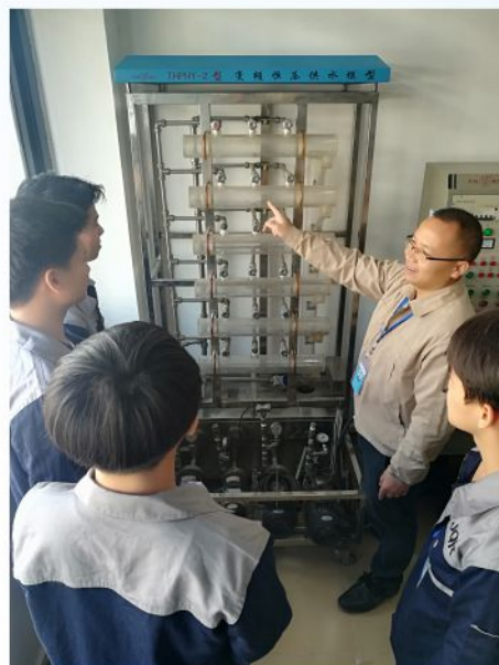
楼宇恒压供水程序编程与调试