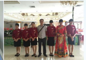
老师到广西南宁凤凰宾馆 看望酒店专业学生