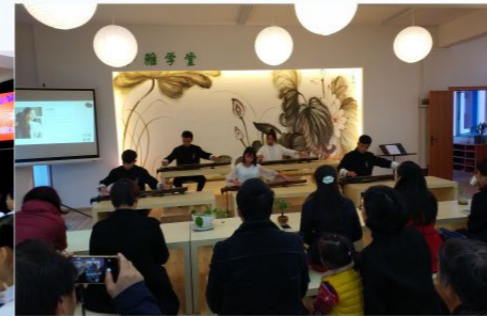
古琴社团的古琴鉴赏会现场