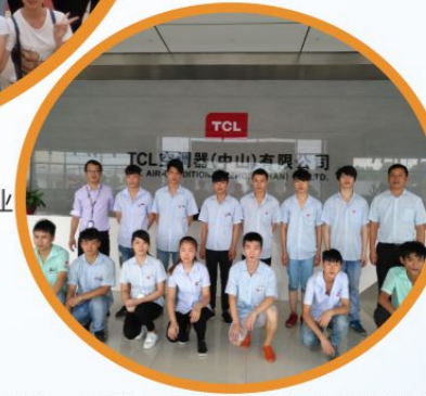
制冷、数控专业学生在中山TCL实习、就业