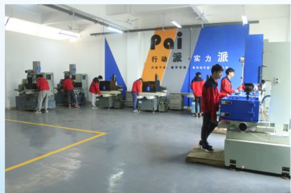
线切割电火花实训室