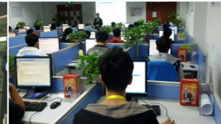
计算机专业学生在山东泰盈科技 有限公司南宁分公司实习、就业