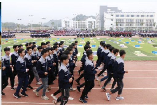
跑操、叠被子比赛成为学生的常规活动