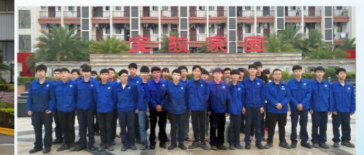
学生在上汽通用五菱汽车股份有限公司就业