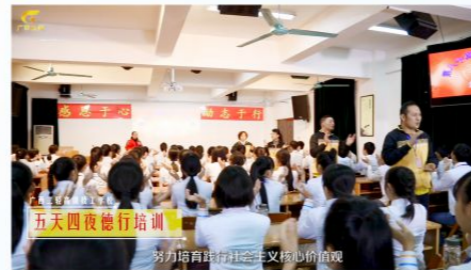
媒体报道我校培育和践行社会主义核心价值观