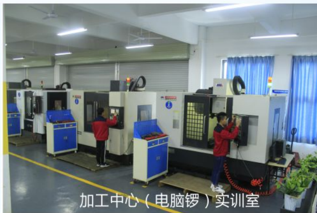
加工中心（电脑锣）实训室

主要课程： CAD与机械制图、机床维修电工、机械基础、车工钳工、金属加工、数控加工编程与操作、数控车床考级、车工考级、数控加工技术、机械制造、公差配合、精密测量MASTERCAM等。