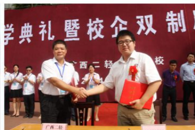
与上汽通用五菱汽车股份有限公司 签订校企合作协议书