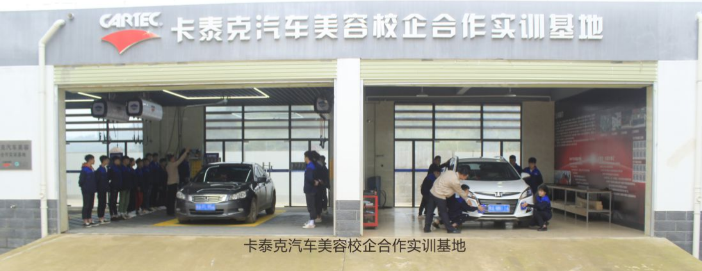
卡泰克汽车美容校企合作实训基地