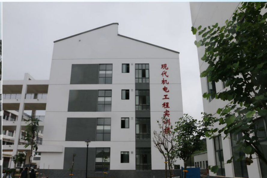
现代机电工程实训楼