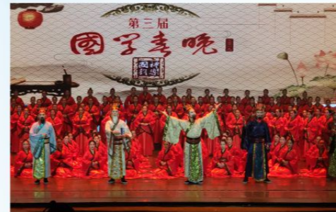
2019年国学春晚晚会节目在中央台播出