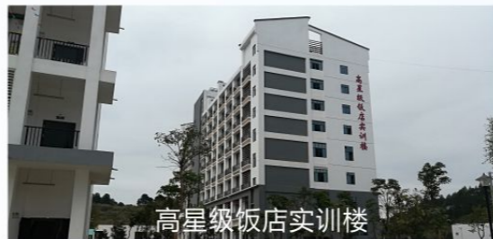
高星级饭店实训楼

广西二轻高级技工学校创办于1956年，是一所具有六十多年办学历史的国家公办学校，是集职业教育、技能培训、技能鉴定、大专和本科函授教育、就业一站式服务的综合性学校。学校占地面积140亩，总投资2.6亿元，在校生4000余人，学校全面实施ISO9001质量管理体系，配备有完善的实训场地和先进的教学设备，帮助学生更好的成人成才。多年来，学校坚持立德树人，将现代办学理念与传统德行教育相结合，注重培养学生懂感恩、知礼仪、有礼貌、会做人、会做事，形成了“内化有德 外显有礼”的德育特色；采用一体化教学模式，效果显著，在全区同类技工院校中起到了引领和示范的作用；坚持“校企双制、合作办学”的理念，实践产教融合，实现毕业生的高质量就业，就业率保持98%以上。