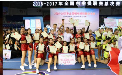
我校勇夺全国啦啦操联赛总决赛亚军